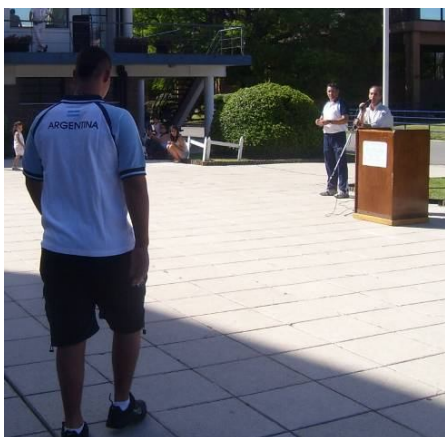
Momento en que dan a conocer al abanderado de la delegación y le hacen entrega de la bandera en el CENARD

"Estoy muy orgulloso por ser el abanderado", repetía. También agradecía a todo adulto que se le acercaba.