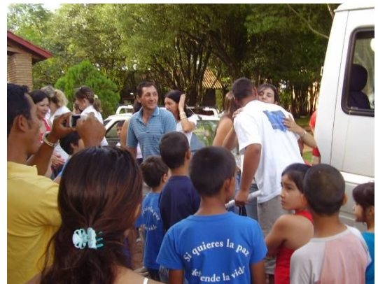
La llegada, bienvenidas, emociones y todos compartiendo su momento