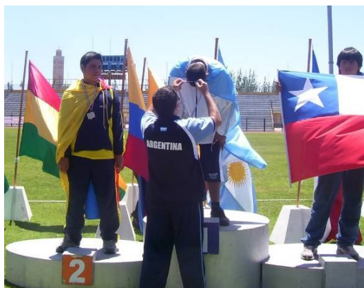
Momentos del lanzamiento y la premiación como Campeón Sudamericano